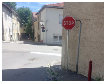
Route de Vernéville

Quelques travaux entrepris par les agents des services techniques de la commune :