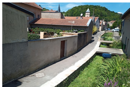
Ruelle du Ruisseau