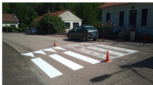
Rue de Verdun