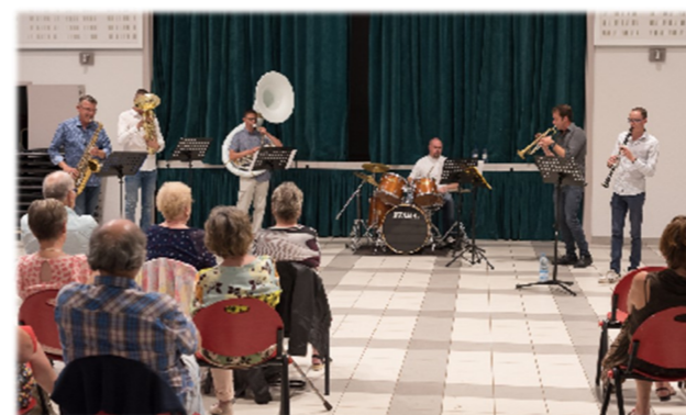
L'ensemble Total Brass

Sept équipes de deux se sont affrontées au tournoi de Molkky sur le parking de la salle des sports le dimanche 19 juin. Une journée sous le soleil qui s'est conclue en toute convivialité autour d'un barbecue.