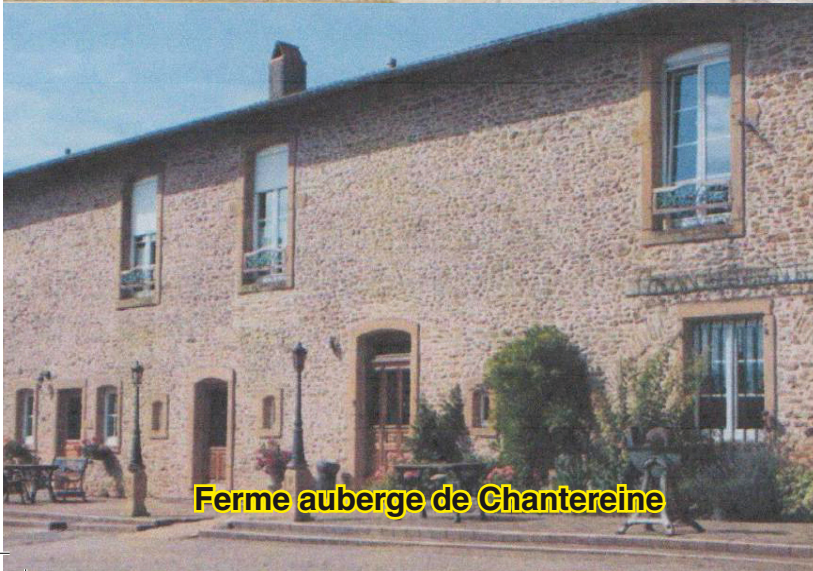
Ferme auberge de Chantereine