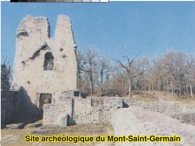
Site archéologique du Mont-Saint-Germain