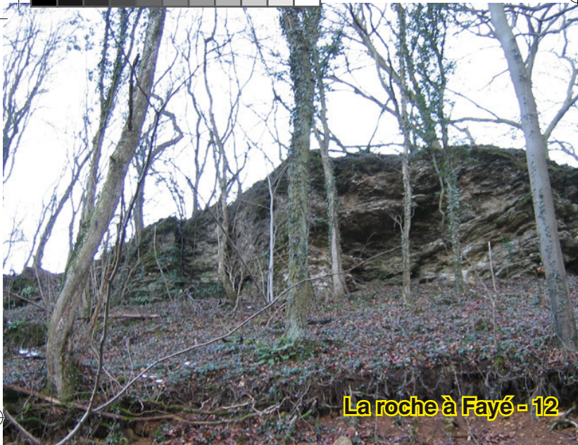
La roche à Fayé - 12