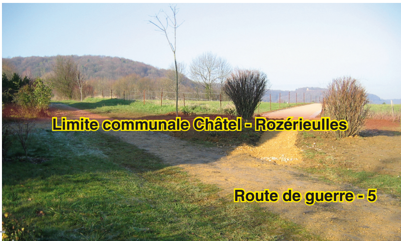
Limite communale Châtel - Rozérieulles

Départ : Place de la Mairie Distance : 8,2 km Temps : 2 h 30